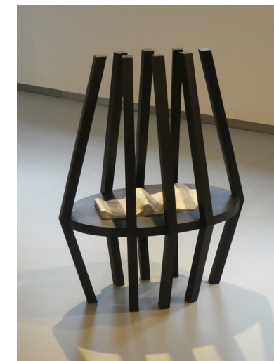
afb. 14 Bart van Deelen, Ecdysis II , 2022, geëboniseerd eik, vergulde Carrera marmer, 91 x 70 x 45 cm.