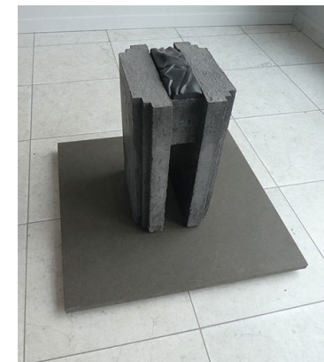
afb. 11 Bart van Deelen, Metamorphosis III , 2022, beton, Agios Petros marmer, 41 x 27 x 21 cm.