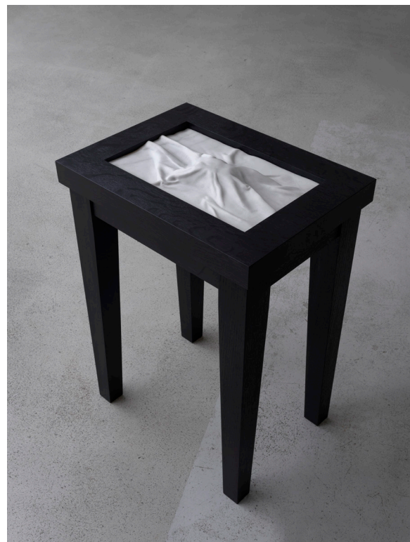
afb. 13a & 13b Bart van Deelen, Pièce de Milieu , 2019, geëboniseerd eik, Sivec marmer, 82 x 59 x 43 cm.

Dat is het werk Pièce de milieu (2019), afb. 13a & 13b mijn eerste werk waar marmer in is verwerkt. In Athene aan de Athens School of Fine Art begon ik te werken met marmer, vanaf dat moment is steen onderdeel geworden van mijn praktijk. Het half jaar in Athene heeft mij zodanig geïnspireerd en gevormd dat dit nog steeds een belangrijke rol speelt in mijn werk.