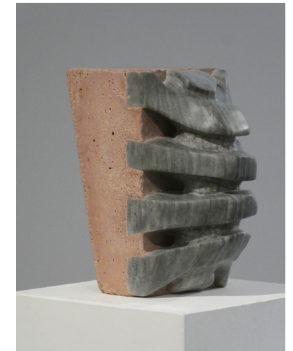
afb. 9 Bart van Deelen, Untitled , 2021, Verde Laguna marmer en beton, 31 x 24 x 17 cm.

Er zijn twee belangrijke ideeën in mijn werk. Een daarvan is om historische objecten of concepten en feiten uit de echte, gewone wereld te halen en hun betekenis door middel van verbeeldingskracht uit te breiden. De ander is om ze onbeweeglijk te maken en daardoor de inhoudelijke essentie poëtisch tegen te spreken. afb. 9 Een terugkerend thema in mijn werk is het concept van de dood, de zoektocht naar het eeuwige leven en het verlangen van de mens naar materiële waarde. (...)