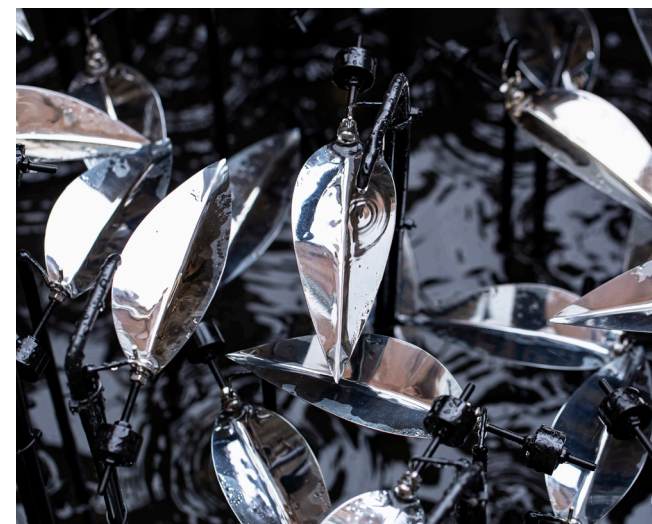
afb. 7 Jelle Korevaar, Hoop , 2021, mixed media, 125 x 125 x 50 cm.

Welke elementen die uit de samenwerking met een 'zakenmaatje' naar voren zijn gekomen, zal je blijven toepassen?