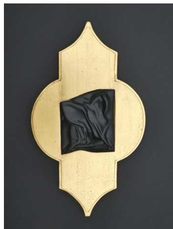
afb. 12 Bart van Deelen, Iphiclydes podalirius , 2023, verguld eiken-houten paneel, Agios Petros marmer, 42 x 25 x 5 cm.

De materialen die ik gebruik zijn vaak traditionele materialen: steen (vaak marmer), hout en beton. Ik werk vanuit het materiaal: wat zijn de eigenschappen, wat is de potentie en hoe kan ik dit tonen en laten spreken. afb. 12 Het materiaal staat daardoor centraal en is dus erg belangrijk. Door esthetische ingrepen probeer ik de verschillende eigenschappen en facetten van het materiaal te tonen, bijvoorbeeld de stofuitdrukking in marmer, het spelen met de nervatuur in het hout en de monumentaliteit van beton. Mijn techniek zou ik omschrijven als klassiek ambachtelijk.