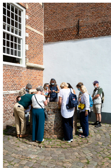
afb. 4 Jelle Korevaar, Hoop , 2021, mixed media, 125 x 125 x 50 cm.