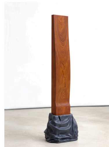
afb. 10 Bart van Deelen, Untitled , 2021, teak en Agios Petros marmer, 139 x 48 x 30 cm.

(...) Mijn inspiratie voor mijn werk heeft hier ook mee te maken. Ik kijk (vooral) naar de connectie of waarde die de mens toekent aan bepaalde objecten en materialen. afb. 11