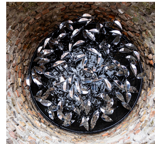
afb. 6 Jelle Korevaar, Hoop , 2021, mixed media, 125 x 125 x 50 cm.